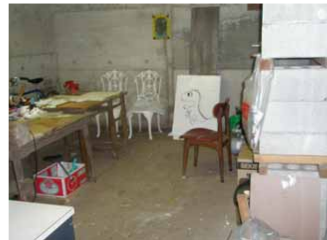
地下の工作室です。