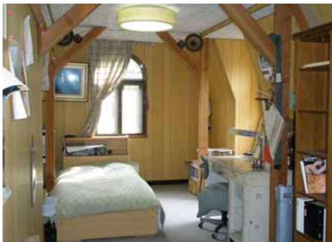
屋根裏部屋 20帖の広さがあります。