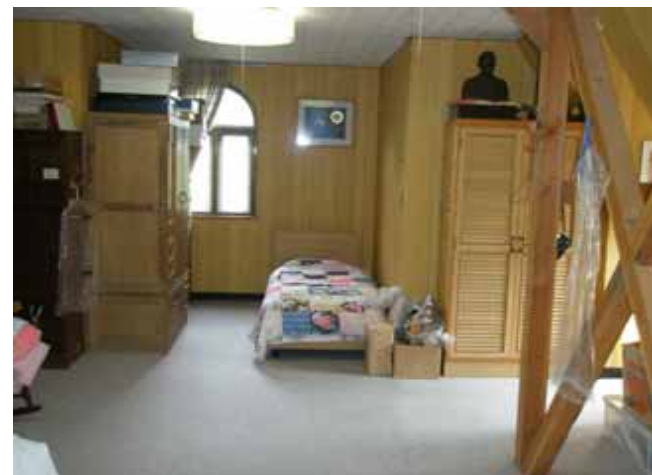
屋根裏部屋 10帖の広さがあります。