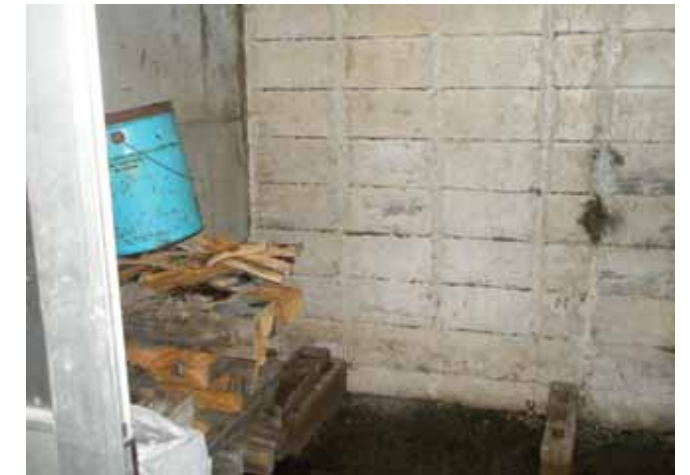
地下の収納室です。