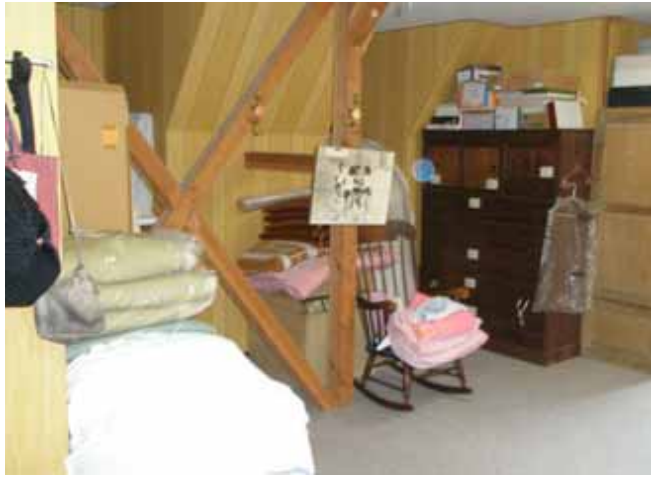
屋根裏部屋 の南側です。