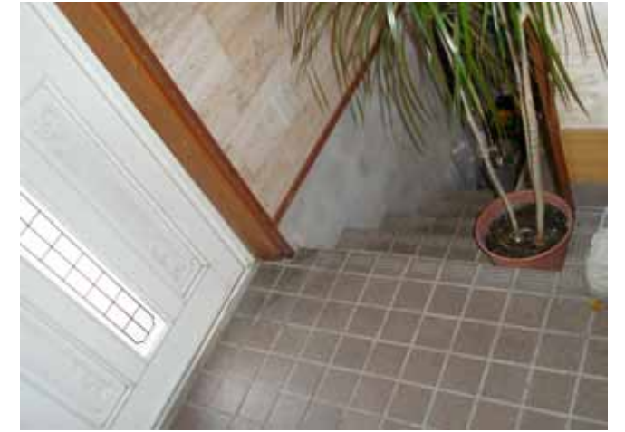
玄関から地下室の入り口です。