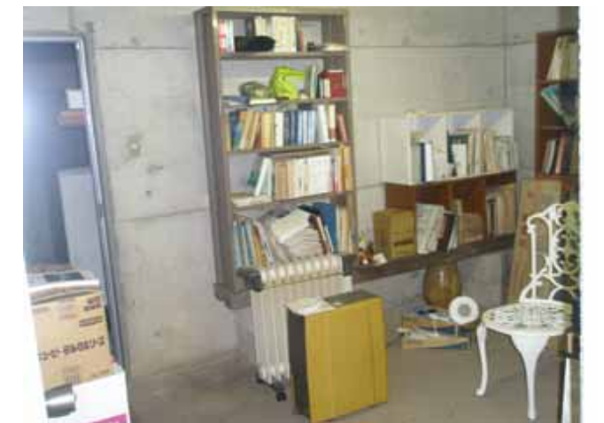
地下の収納室です。