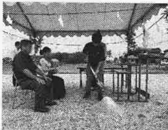
米子市彦名町にて

地鎮祭は「とこしずめのまつり」とも言われ、その土地の神(氏神)を鎮め、土地を利用させてもらうことの許しを得るといふ儀式。1500年近い歴史がある儀式です。完成を楽しみに思いつつ、身が引き締まります。