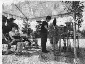
米子市夜見町にて