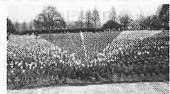
世良高原のチューリップ

4月29日・30日の完成見学会からスタートした弊社のGW。後半も「住まいの相談会」開催で交代しながらの連休でしたが、創業記念日の休日にも間に挟み、気分転換しました。